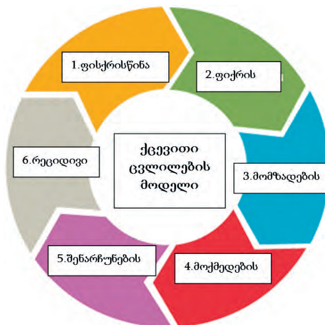
დიაგრამა 1: ცვლილების ეტაპები

მოტივაციური ინტერვიუება, ასევე, იყენებს პროჩასკასა და დიკლიმენტეს ტრანსთეორიული მოდელის ცვლილების ეტაპების თეორიას (როგორც ციტირებულია Velicer et al., Fleet & Annison, 2003). ამ მოდელის თანახმად, ადამიანი გადის განსხვავებულ ეტაპებს საკუთარი პრობლემური ქცევის სასურველი ჯანსაღი ქცევით შეცვლის გზაზე და ყოველი ეტაპი მას განსხვავებული დილემის წინაშე აყენებს, რაც გათვალისწინებული უნდა იყოს იმ სპეციალისტების მიერ, რომლებიც ეხმარებიან ამ ადამიანს ცვლილების განხორციელებაში. ეს ეტაპებია: ფიქრისწინა, ფიქრის, მომზადების, მოქმედებისა და შენარჩუნების ეტაპები. საგულისხმოა, რომ მოდელის ავტორთა აზრით, ცვლილებათა ეტაპებს სპირალური ხასიათი აქვს, რაც იმაში მდგომარეობს, რომ ადვილად შესაძლებელია გვიანდელი ეტაპიდან ადრეულ ეტაპზე დაბრუნება. ცვლილების მიღწევის თვალსაზრისით წარმატებული ადამიანები ახერხებენ აღნიშნული სპირალიდან თავის დაღწევას.