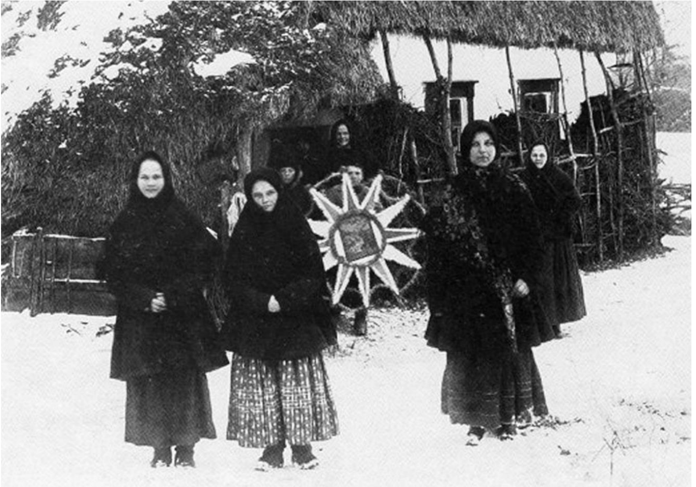
კოლიადა (საშობაო და საახალწლო რიტუალი)

ლირნიკები). არცთუ ისე იშვიათია ქალაქური, განათლებული ფენის, პლასტიც.