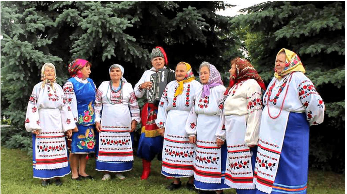
უკრაინელი ტრადიციული მუსიკოსები

უკრაინული საკრავიერი მუსიკა დიდი მრავალფეროვნებით გამოირჩევა. საკრავებს უკრაინელები ხშირად სიმღერის თანხლებისათვის იყენებენ. საკუთართან ერთად საერთო სლავურ ( ბუბნა – დაირა, როგ – ბუკი, ფლოერი – დასავლურ-სლავური ობერტონული ფლეიტა, რომელიც გუცულებში ზოგჯერ გლოვის დროსაც იკვრებოდა, ციტრა , ლიტავრა , ბარაბანი და ა.შ.) და ნასესხებ ( სკრიპკა – ვიოლინო) საკრავებზეც უკრავენ. საერთოდ, უკრაინელებს სხვადასხვა ყაიდისა და ტიპის საკრავთა შთამბეჭდავი გალერეა აქვთ. სასულე საკრავთაგან გამოირჩევა სალამური სოპილკა , ტილინკა , გუდასტვირი დუდა ( კოლინკა ), სასიგნალო ერთბგერიანი ჩასაბერი ტრემბიტა . სიმებიან საკრავთაგან აღსანიშნავია ყელიანი კობზა და ბანდურა (შედარეთ: ქართული ფანდური , ბერძნული პანდორა ), ციტრას ტიპის გუსლი , ციმბალი , ვიოლონჩელის მსგავსი ბასოლია . იდიოფონებია (მარტივი მოუმართავი საკრავები): დრიმბა (ვარგანი, პირით გამოსაკრავი ლითონის პატარა ნაჭერი), სვისტუნცი (თიხის სასტვენები) და ა.შ. გარდა სოლო საკრავიერი მუზიცირებისა და სიმღერის თანხლებისა, გავრცელებულია სხვადასხვა შემადგენლობის ინსტრუმენტული ტრიო ტროისტა მუზიკა .