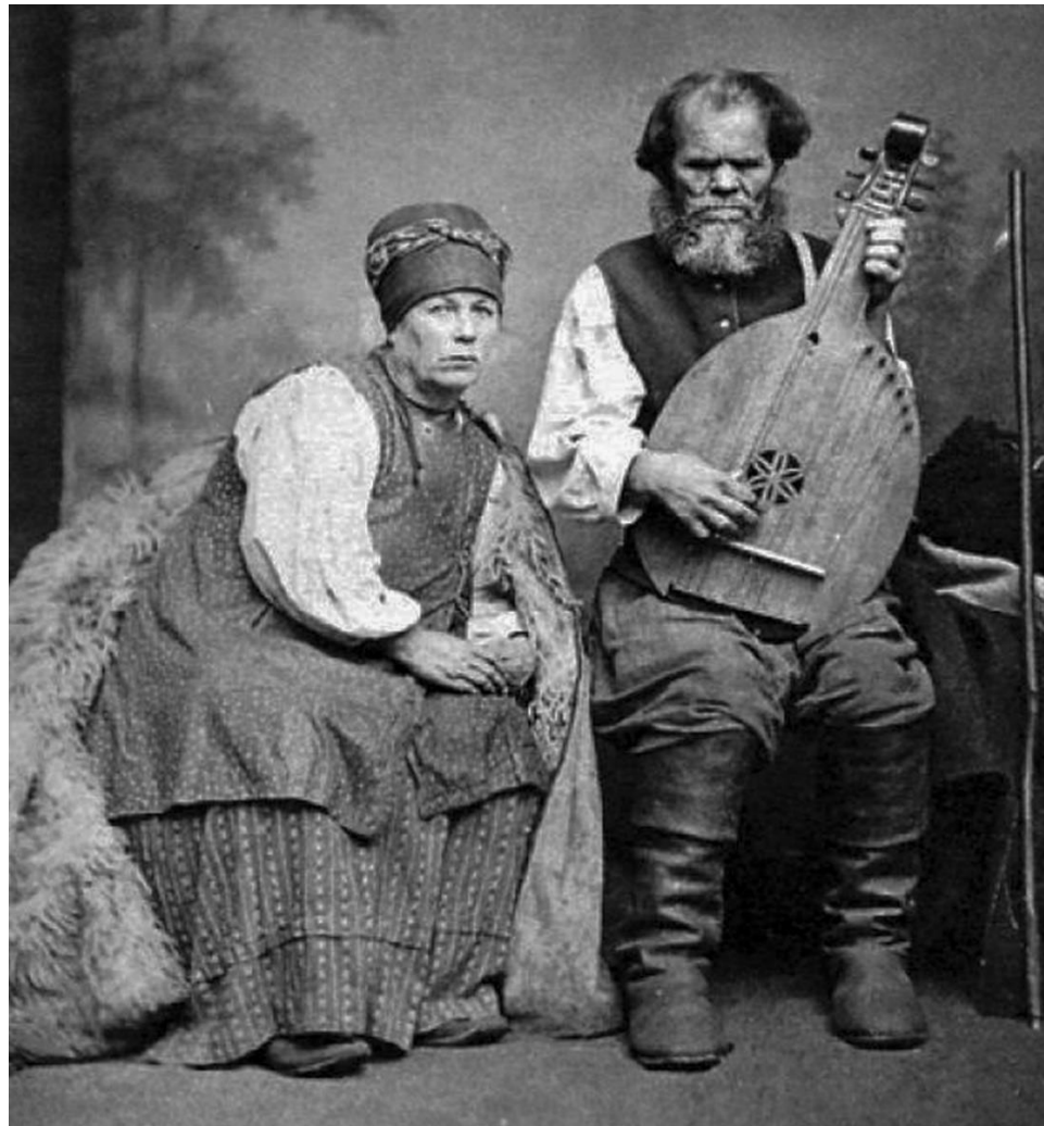
კობზარი მეუღლესთან ერთად

დასავლეთ უკრაინაში), რომელთა შორის გამოირჩევა ცნობილი რეკრუტული (ომში გაწვევის) სიმღერა იხავ კოზაკ ზა დუნაი ( Іхав козак за Дунай – კაზაკი დუნაიზე გადადიოდა ). მისი ინტონაციები შეიცნობა ცნობილ ტიჟ მენე პიდმანულაში). მსგავსი მოტივაციით ხასიათდებოდა აჯანყებულთა (პოვსტანსკი) სიმღერები, რომლებშიც საბჭოთა პერიოდის საპროტესტო განწყობა აისახა. გერმანული ნაციზმის ექსპანსიას ახალი საპროტესტო მუსიკალური ტალღა მოჰყვა, რომლის ნიმუშია ნევილნიცკი პისნი ( Невільницькі пісні – ტყვეების სიმღერები ).