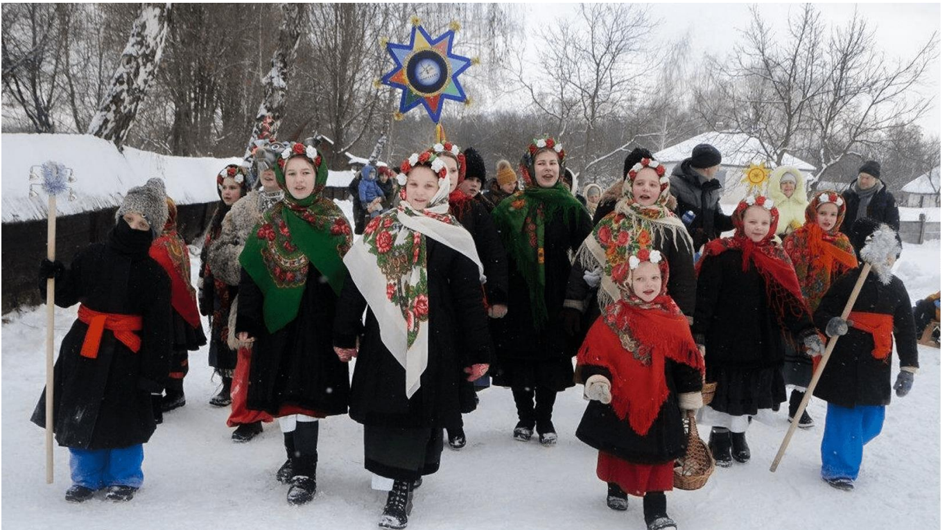
შედრივკა (საშობაო რიტუალი)

ზოგიერთ უკრაინულ ხალხურ მუსიკალურ რიტუალში თეატრალური ელემენტები მკაფიოდაა შენარჩუნებული. მრავალი ასეთი სანახაობა ქრისტიანულ სიმბოლოებთან (ქრისტიანული ეპოქის გავლენით) ადაპტირდება. ასეთია, მაგალითად, რუსალკა (სირინოზი), რომელიც წმიდა სამების დღესასწაულს ემთხვევა, პეტრე-პავლობასთან დაკავშირებული პეტრივჩანის სიმღერები. მას მალევე მოჰყვება კუპალის სარიტუალო ციკლი: ქალ-ვაჟთა სიმღერა და ფერხული, კოცონზე გადახტომა, თოჯინის განზანა ან დაწვა, ყვავილების გვირგვინის დაწვნა, წყალში ჩაშვება, მკითხაობა და ა.შ. ვესნიანკებითა და გაგილკებით ქალები, უმეტესწილად, გაზაფხულს იწვევდნენ. ისმოდა შეძახილები, სადა მღერა. ხალხური მუსიკით გაჯერებული უკრაინული საქორწილო რიტუალი უკრაინსკე ვესილია ზოგჯერ ერთი კვირაც კი გრძელდებოდა.