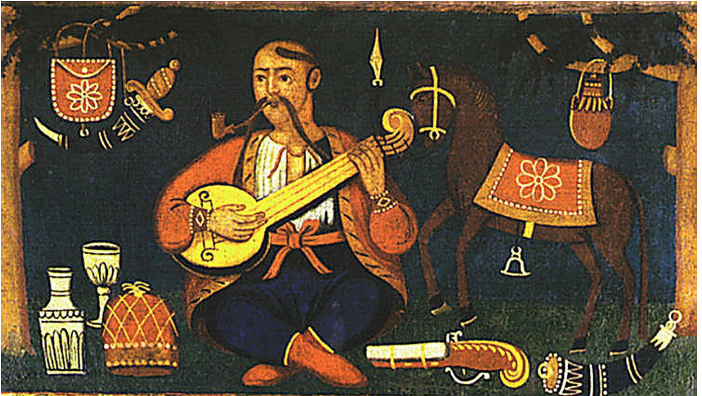
#მსოფლიო კულტურული მემკვიდრეობა -- ჟურნალი #1