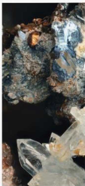
Scharfkantiges Gold-Kriställchen neben Bleiglanz und Bergkristall. Stellen bei Ieli, Nähe Mestia, Swanetien. Bildhöhe 6,3 mm. – Unten ein Detailfoto des ikosaedrischen Goldkristalles (er misst 0,7 mm). Sammlung Rudolf Geipel, Foto: Josef Penzkofer