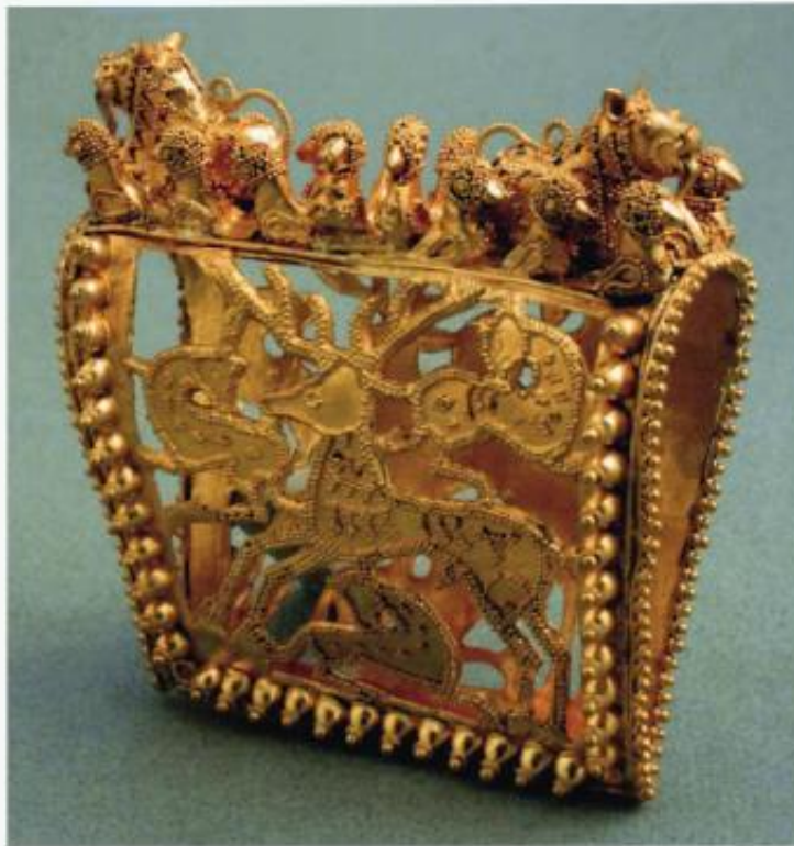
Einen Beweis für die hochstehende Technik der antiken Goldbearbeitung liefert dieses filigrane Werk mit einer Hirschfigur und Miniaturen von Vögeln und Löwen, aus dem 4. Jahrhundert v. Chr. Breite: ca. 6,5 cm. Sammlungen des Georgischen Nationalmuseum in Tiflis