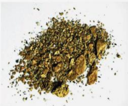
Unten rechts: Großes Goldnugget (2,5 cm) mit Quarzkörnern, aus einem alten Bergwerkstollen in der Nähe von Ieli bei Mestia. Sammlung des Goldsuchers Ghio aus Ieli.