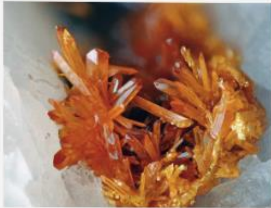
Links: Realgar-Stängel mit Kopfflächen, auf Auripigment. Sb-As-Au Lagerstätte Lukhumi, Racha, Georgien, Länge der Kristalle bis 1,4 cm, Sammlung und Foto: Boris Kantor. – Rechts: Auripigment-Kristalle aus der Sb-As-Au Lagerstätte Lukhumi, Racha, Georgien. Bildbreite 7 mm, Sammlung und Foto: Josef Perukoler (Geschenk von Heinz Hublitz)

lysen unterschiedlichste Bilddaten der Erdkruste liefern. Die Fernerkundung von Oberswanetien erfolgte durch das General Directorate of Mineral Research and Exploration (MTA) der Türkei im Auftrag der Bergbaufirma „Golden Fleece“. Dabei wurden auch Daten des Multispektralsatelliten Terra ASTER verwendet. Die Ergebnisse dieser Fernerkundung bestätigen die bisherigen Erkenntnisse über die geologischen und bergbauhistorischen Informationen, liefern aber auch Hinweise auf neue Seifengoldvorkommen.