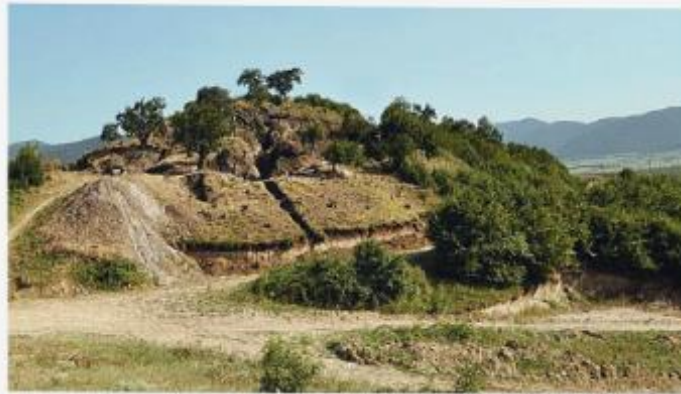
Älteste bekannte Goldmine der Welt: Der Abbau Sakdrisi aus der frühen Bronzezeit war zu Beginn des 3. Jahrtausend v. Chr. erstmals aktiv. Er liegt am Kachagiani-Hügel in der Nähe von Bolnisi in der südostgeorgischen Region Niderkartlien. – Unten: Neuer Gold-Tagebau an der Stelle der alten Goldmine Sakdrisi am Hügel von Kachagiani. Der historische Goldabbau ist zerstört, die Fundstelle ist umzäunt und kann nicht betreten werden. Foto im September 2019

Eine wichtige Gold- und Arsenlagerstätte im Großen Kaukasus ist das Lukhumi-Feld in Racha, das zuvor nur für Arsenbergbau in Betracht