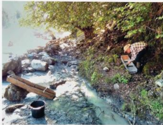
Oben links: Der goldführende Fluss Enguri zwischen Mestia und Ushguli. – Oben rechts: Swanetischer Goldsucher am Ufer des Enguri.