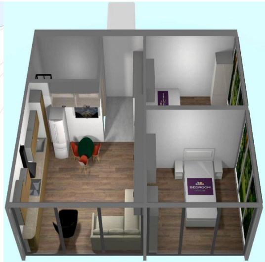
ილუსტრაცია 4: ე.წ ბინის შიდა დიზაინი.