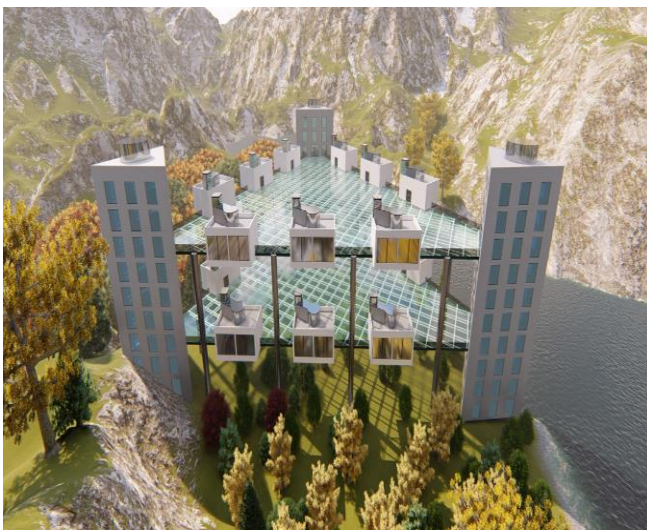
ილუსტრაცია 1: კომპლექსის ესკიზ-რენდერი 1.